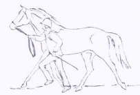
Käännökset aina esittäjästä pois päin