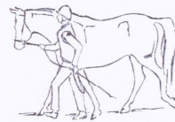
Liikkeet esitetään suoraviivaisesti