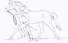
Käännökset aina esittäjästä pois päin